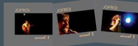
Survols 1 / 2 / 3