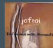
En l'an deux mille, l'humanité La robe rouge J'ai l'moral

La Marie-Tzigane n'est pas un bateau Mario, si tu passes la mer L'odeur de la terre Si ce n'était manque d'amour Jofroi et les Coulonneux Petit Roy