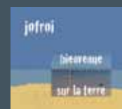
Bienvenue sur la terre