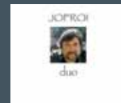
Duo - double CD en public