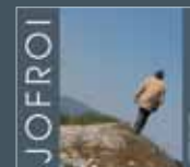
Cabiac sur terre